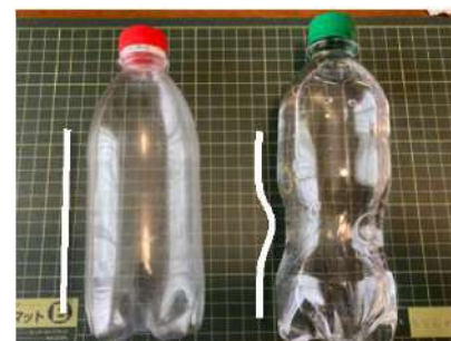
○ くびれなし △ くびれあり